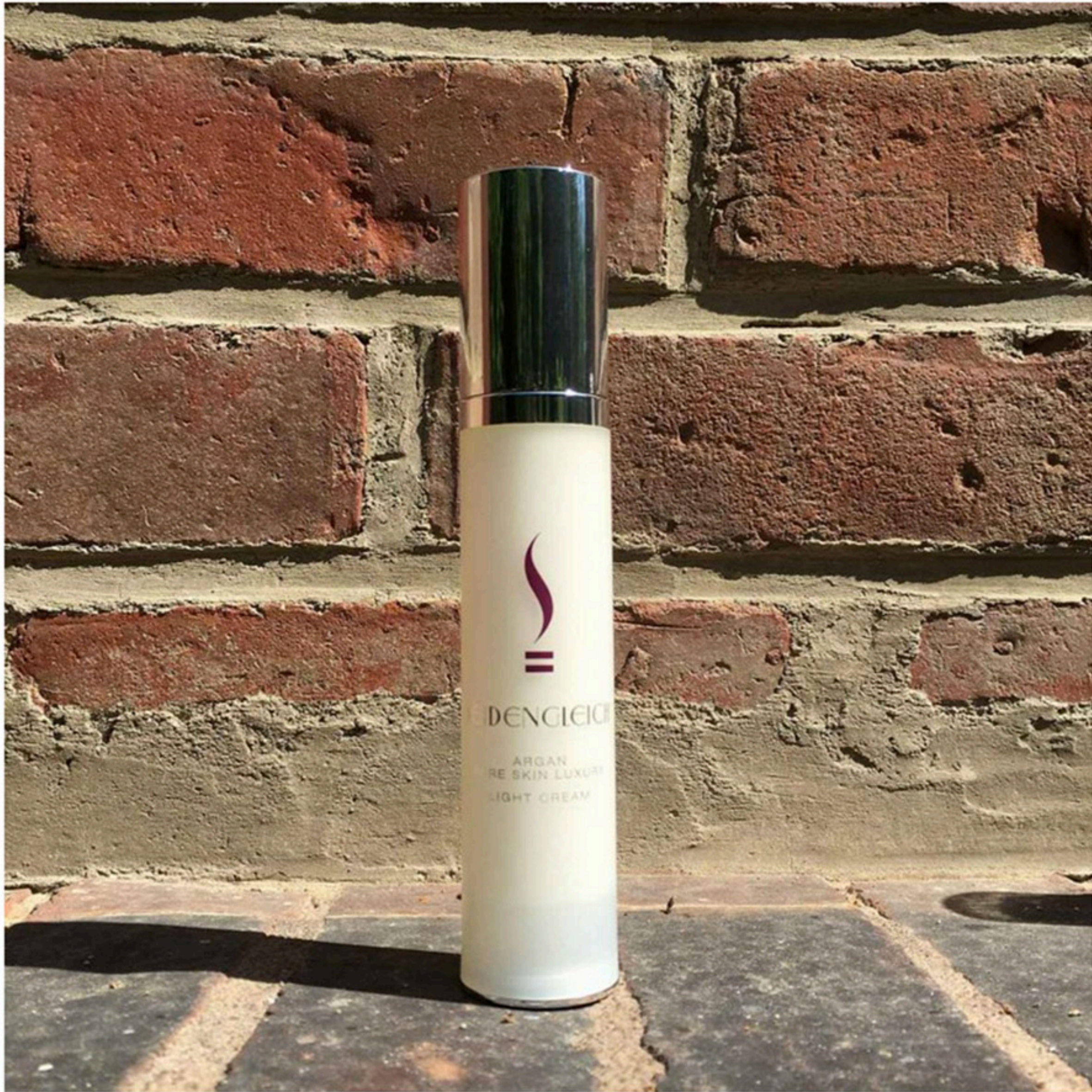
Hochdosiertes, reines Argan-Öl + innovative Pflegeformel = Luxuspflege für hochsensible Haut